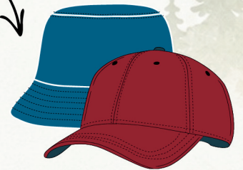
Casquette / bob / chapeau