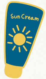
Crème solaire indice 50