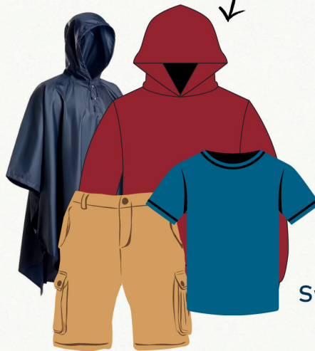
Sweat ou polaire