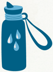
Gourde (50cl minimum)