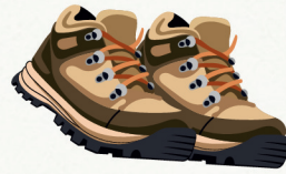
Basket de sport / Chaussures de randonnée