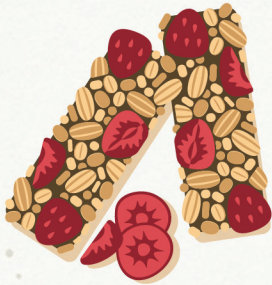
Un goûter pour les petites faims